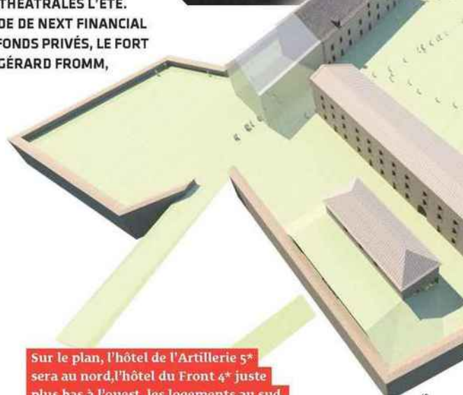
Sur le plan, l'hôtel de l'Artillerie 5* sera au nord, l'hôtel du Front 4* juste plus bas à l'ouest, les logements au sud, les commerces et le centre des congrès à l'est.

Cette richesse patrimoniale est avant tout une chance, mais aussi un lourd fardeau. « Depuis huit ans, sous forme contractuelle, 1,5 Me est injecté chaque année pour les fortifications d'une manière générale, par la ville (20 %), le département (20 %), la région (20 %) et la Drac* (40 %) », détaille le maire. Le fort des Têtes appartient toujours à l'armée. « Ces derniers temps, l'armée dépense entre 700 000 € et 1,4 Me par an pour entretenir les fortifications. On ne peut pas avoir des structures vides et continuer à y mettre de l'argent ! », s'exclame le maire. Plus alarmant encore, un palmarès