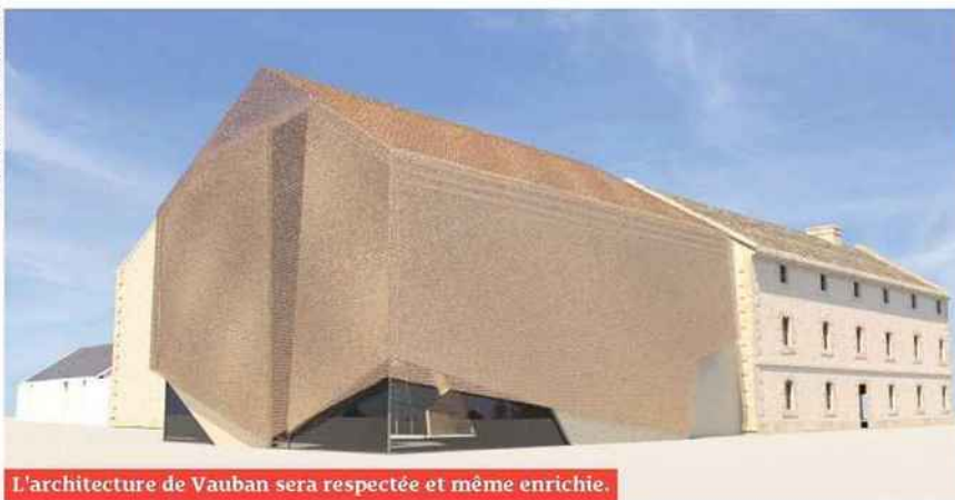
L'architecture de Vauban sera respectée et même enrichie.